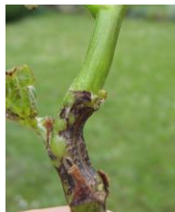
Nécrose à la base du rameau

Dans des parcelles touchées l'an dernier par l'excoriose, les premiers symptômes foliaires (petites taches brunes) et sur les rameaux (nécroses en plaque de chocolat) sont identifiés.