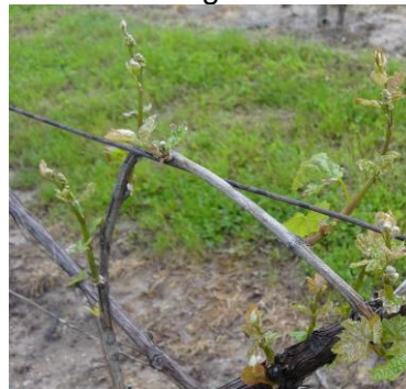
Dambach la ville 16/05

Les parcelles gelées repartent en 2 temps. Les moins atteintes ont un aspect « eutypiose » avec des rameaux dénudés de par la perte des premières feuilles gelées.